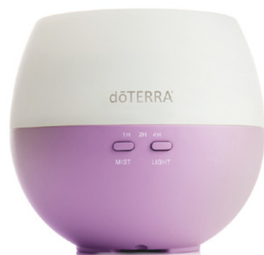
«Лепесток» | PETAL