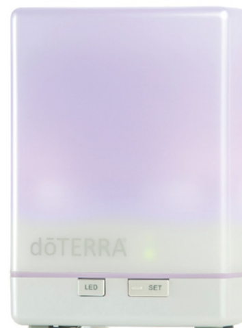
«Арома Лайт» | AROMA LITE