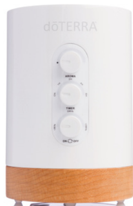
«Облако dōTERRA» | dōTERRA CLOUD