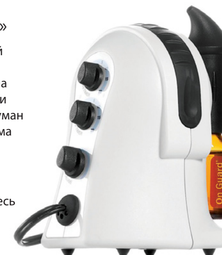
«Арома Айс» | AROMA ACE