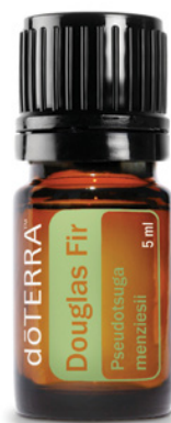
МАСЛО ДУГЛАСОВОЙ ПИХТЫ