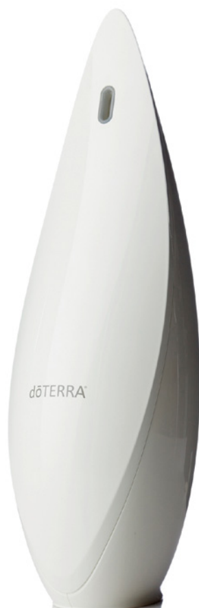
«Лотос» | LOTUS